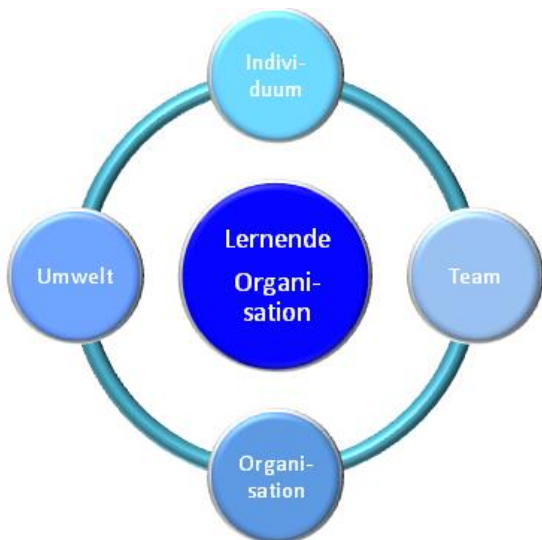
Abbildung: Ebenen-Modell einer lernenden Organisation

Eine lernende Organisation zeichnet sich dadurch aus, dass Ihre Mitarbeiter bewusst und gemeinsam über ihr Selbstkonzept, ihr Handeln und die dadurch erzielten Ergebnisse reflektieren und über Methoden und Strategien verfügen, um in einem kontinuierlichen Veränderungsprozess die Organisation weiterzuentwickeln.