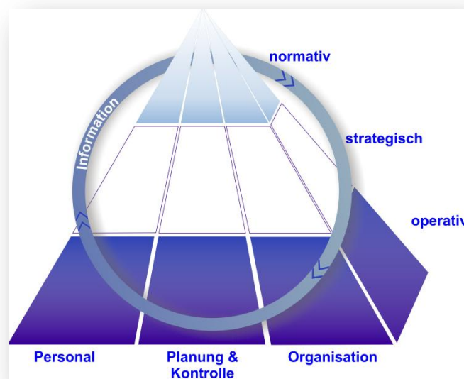
Abbildung: Strategische Unternehmensführung im integrierten Führungssystem 3